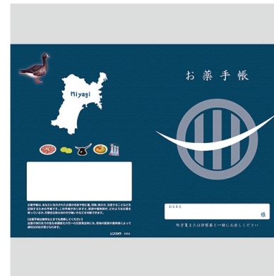
北海道・青森・岩手・宮城