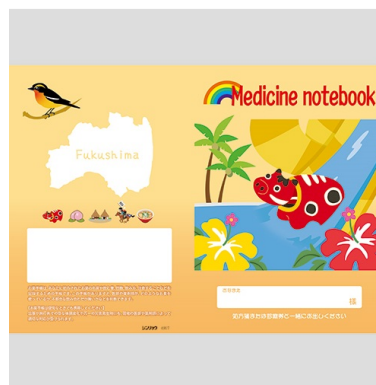
岩手・山形・福島