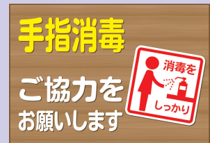
953134 消毒液スチレンボード/茶