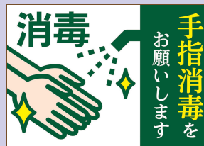
953132 消毒液スチレンボード/緑