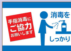
953133 消毒液スチレンボード/青