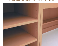
棚板は収納物に合わせて高さ調節 ができます。(30mmピッチ)