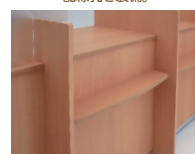
お客さま側に荷物置きスペースを 快適に使用していただけます。