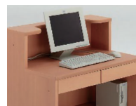
モニターを設置しながら接客 天板面を確保しています。