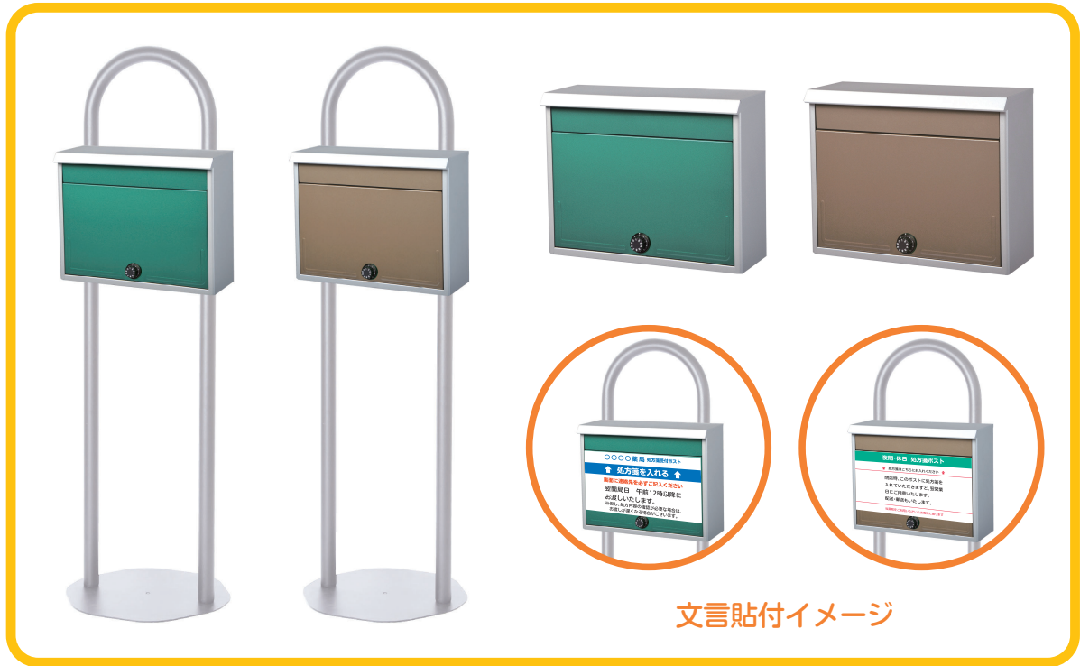
文言貼付イメージ

お昼休み・閉局後・休局日などに持ち込まれた処方箋をポストで受け取り 受付待機時間・処方待ち時間がなくなり、 使用した患者様にとっても嬉しいシステム