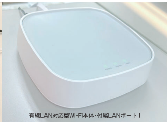
有線LAN対応型Wi-Fi本体・付属LANポート1