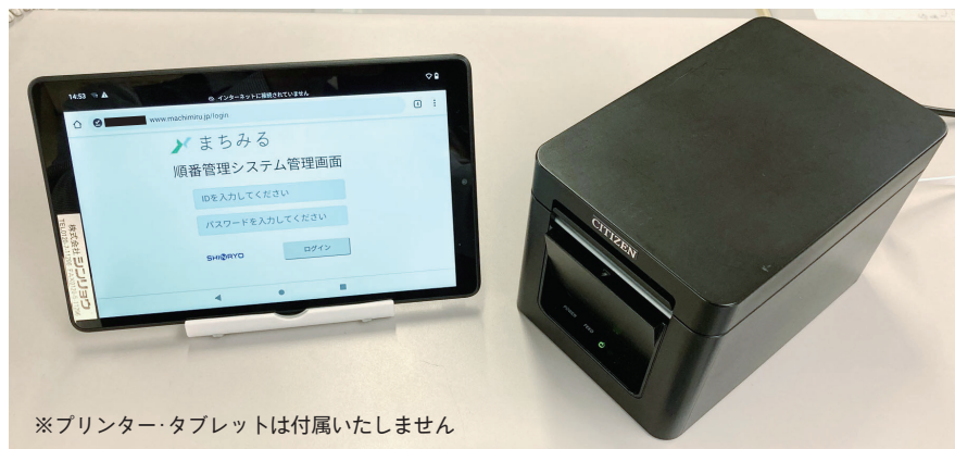
※プリンター・タブレットは付属いたしません