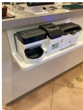
設置カウンター加工

設置カウンターの加工・作成、LANケーブル敷設、電源コンセント追加 といった設置環境の構築もお手伝い致します。