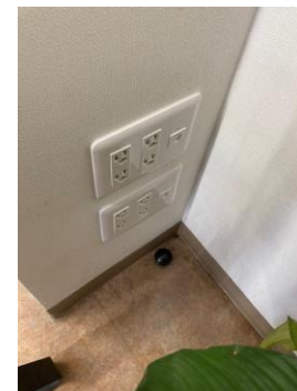
電源コンセント追加