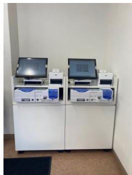
設置カウンター作成